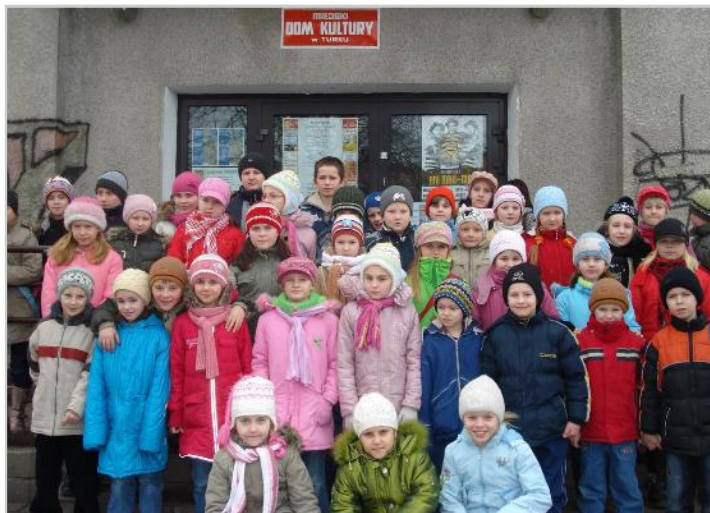
Uczniowie ze SP w Miłaczewie przed Domem Kultury w Turku

Wychowawczynie zorganizowały dla uczniów klas I - IV trzy wyjazdy do Turku: do Miejskiego Domu Kultury i kina „Tur”. Już w pierwszym dniu ferii -16 lutego - uczniowie oglądali spektakl teatralny pt. „Pinokio”. Ta sama grupa uczniów w dniu 24 lutego obejrzała film pt. „Franklin i skarb jeziora”, a w dniu 25 lutego uczestniczyła w teatryku pt. „Baśń o dwunastu miesiącach”.