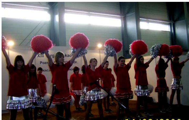
Układ taneczny w wykonaniu klas pierwszych

W sobotę 14 marca 2009 r. uczniowie Gimnazjum w Malanowie wzięli udział w XIII Targach Edukacyjnych w Poznaniu.