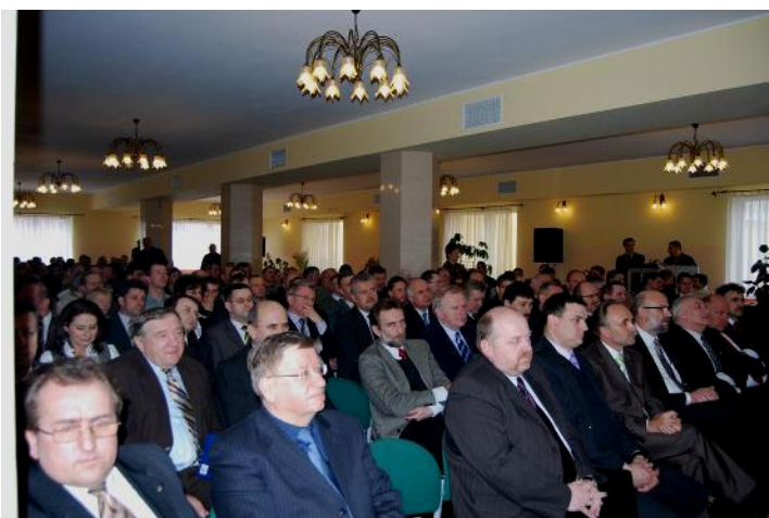
Frekwencja na forum dopisała

Następnie Prezes Krajowej Izby Rolniczej przedstawił zebranym projekt nowelizacji ustaw o Izbach Rolniczych, a także podejmowane przez nią działania w sprawie nasilających się szkód łowieckich. Dużo uwagi poświęcono problemowi funkcjonowania służb zespolonych, zwłaszcza inspektoratów weterynarii, ochrony środowiska oraz ochrony roślin na usługach rolnika.