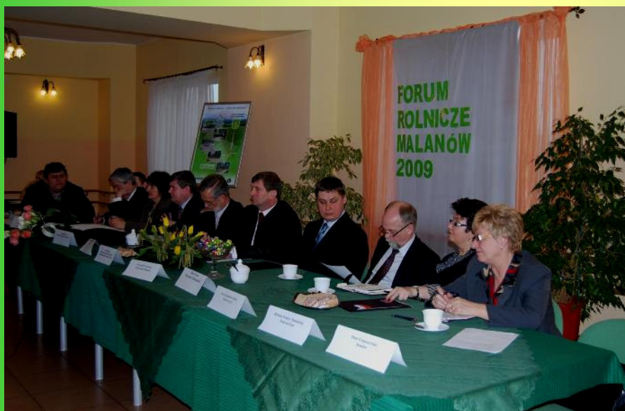
Goście forum rolniczego