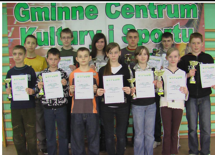
Najlepsi zawodnicy turnieju