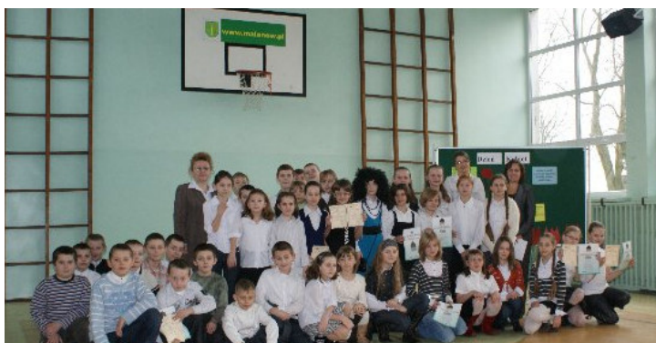
Uczniowie biorący udział w uroczystej akademii

W naszej szkole, w poszczególnych klasach, różnie obchodzono to święto. Chłopcy wręczali swoim koleżankom maskotki, kwiatki i inne upominki oraz przygotowywali pyszne, słodkie poczęstunki. Nie zapomnieli oczywiście o swoich Paniach, które otrzymały przepiękne, pachnące, kolorowe bukiety.