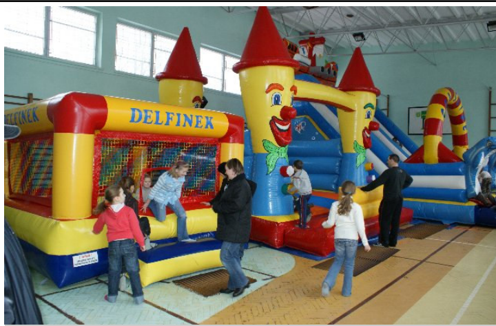
Dmuchany plac zabaw

Uczniowie klas młodszych mogli uczestniczyć