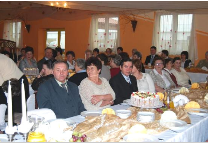
Na uroczystość licznie dopisali członkowie stowarzyszenia

Z tej okazji sześciolatki z Gminnego Przedszkola w Malanowie przygotowały uroczystą akademię. Milusińscy oczarowali wszystkich zebranych recytując wiersze i śpiewając piosenki z tematyczną dedykacją. Uroczystość ubarwił występ zespołu „Jarzębinki”, działającego przy Gminnym Centrum Kultury i Sportu w Malanowie, który zaprezentował zebranym swój talent komediowy.