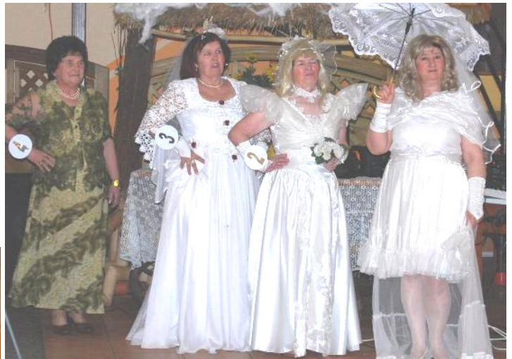
Kandydatki na Miss Malanowa 2009 w sukniach ślubnych

Tego dnia, pod adresem pań padło wiele ciepłych i serdecznych słów. Życzenia zgromadzonym Paniom