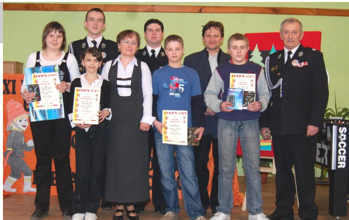
Laureaci konkursy wraz z opiekunami i organizatorami